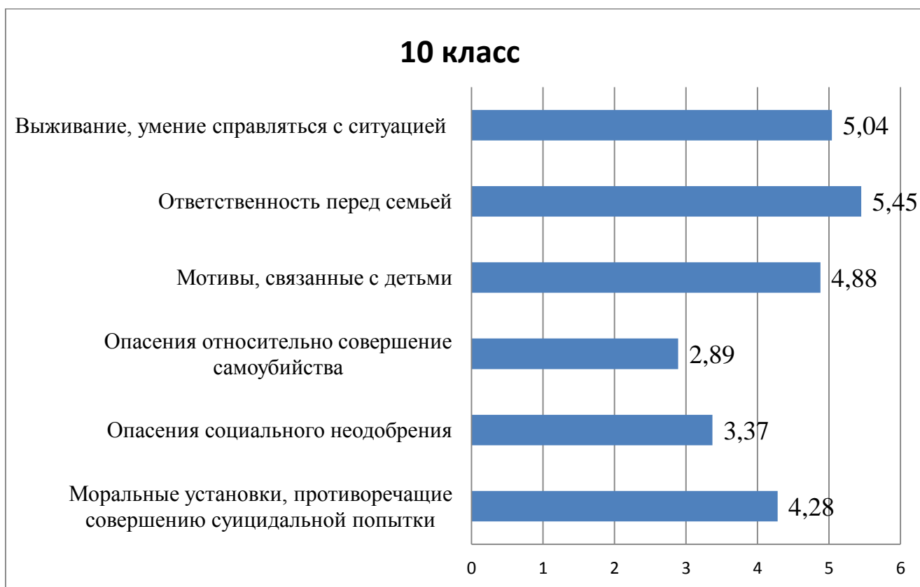
Рис. 2. Средние значения представленности мотивов суицидального риска по опроснику антисуицидальных мотивов М.В. Олиной.

Далее проводилось исследование на изучения мотивов суицидального риска подростков по методике изучения мотивов суицидального поведения М.В. Олиной. Рассмотрим результаты на рис. 2.