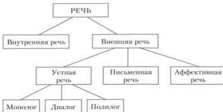
Рис. 1.1. Речь в процессе общения

Аффективная речь – это вид речи, заключающийся в односложности и ограниченности, строится на отдельных словах, реже – фразах. Данный вид речи наиболее эмоционально насыщен и интонирован. В аффективной речи отсутствуют какие-либо грамматические конструкции (рис. 1.1) [2].